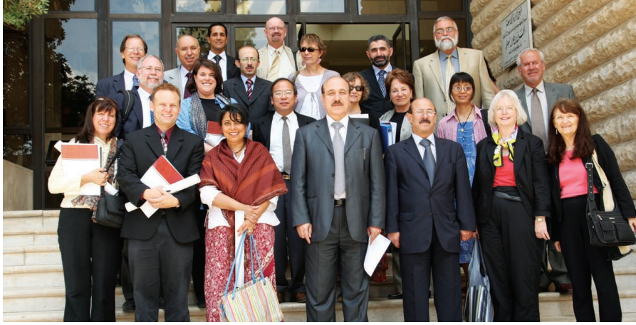
الجامعة ترحب بضيوفها