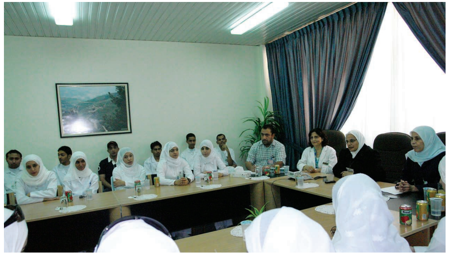
الممرضون العمانيون أثناء الدورة

بدوره أبدى الضيف استعداد جامعة «وسكينسون» على دعم البرامج السياحية في كلية السياحة والفندقة المنوي إنشاؤها في الجامعة الأردنية فرع العقبة.