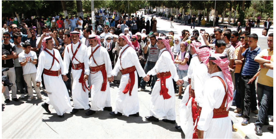
الأردنية تعبر عن فرحتها بولي العهد

وحت أبو رمان زملاءه الطلبة على مضاعفة جهودهم العلمية ليكونوا مشاريع نهضة لاستكمال بناء الأردن الحديث والقوي وتأسيس مرحلة جديدة في جميع المجالات التنموية الشاملة. وتضمن الاحتفال إلقاء قصائد شعرية معبرة وقدمت أغان وطنية تراثية بمشاركة فرقة معان للفنون الشعبية التي قدمت لوحات فنية مستوحاة من الفلكلور الأردني العريق. وخلال الحفل وقع أكثر من ألف طالب وطالبة على وثيقة تهنئة ومباركة لجلالة الملك عبد الله الثاني بهذه المناسبة العزيرة سيصار إلى رفعها لجلالته في وقت لاحق بحسب رئيس اتحاد الطلبة.